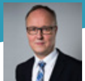
Conny Wahlström, Staatssekretär im schwedischen Ministerium für Wirtschaft und Innovationen