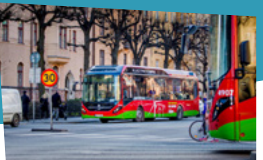
Elektro-Hybridbus, Stockholm, Schweden

Moderne Gesellschaften stehen heute vor der großen Herausforderung, die zukünftige Wirtschaftsentwicklung nachhaltig zu gestalten. Um dieses Ziel zu erreichen, müssen die Weichen bereits heute gestellt werden.