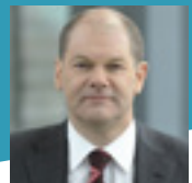
Olaf Scholz, Erster Bürgermeister der Freien und Hansestadt Hamburg